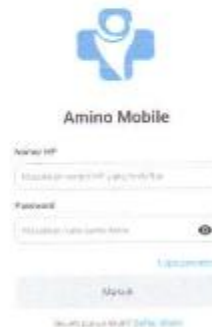
Gambar 1. 3 halaman login app admin

Setelah splash screen beberapa saat, maka aplikasi akan menampilkan halaman login.