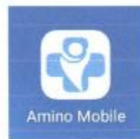
Gambar 1. 1 Icon Aplikasi Amino Mobile

Setelah aplikasi berhasil diinstal, maka akan muncul icon seperti gambar 1.1