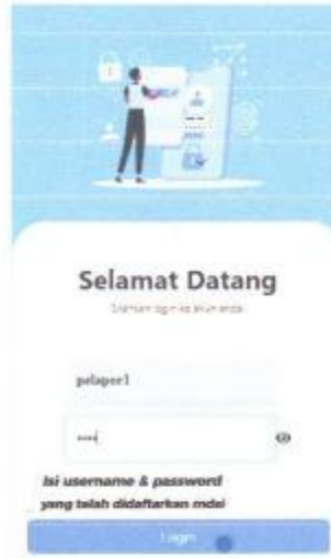
Gambar 1. 6 Tampilan login pelapor

Masukkan username dan password yang telah didaftarkan MDSI