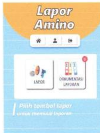
Gambar 1. 7 Menu pembuatan laporan