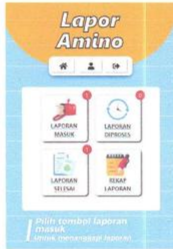
Gambar 1. 12 Menu Lapor Amino petugas

Pilih menu laporan masuk untuk menanggapi laporan.