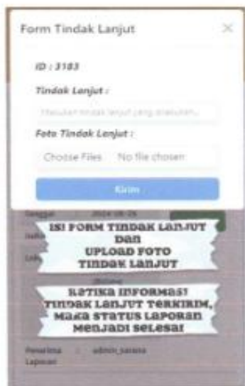
Gambar 1. 19 Form Tindak lanjut

Pada Form Tindak lanjut, diisi tindak lanjut serta prosenya oleh petugas untuk menyelesaikan laporan.