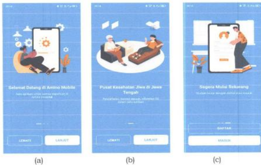
Gambar 1. 2 Splash Screen app

Setelah aplikasi berhasil diinstal, maka akan muncul icon seperti gambar 1.1