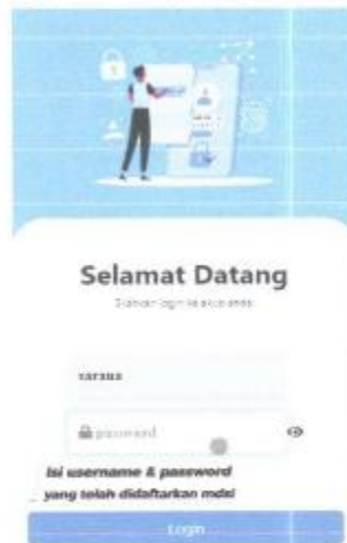
Gambar 1. 11 Tampilan Login Petugas

Pengguna mengisi username dan password yang sudah didaftarkan MDSI