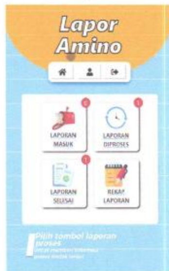
Gambar 1. 17 Menu laporan proses

Pada menu Laporan Proses, terdapat informasi proses tindak lanjut