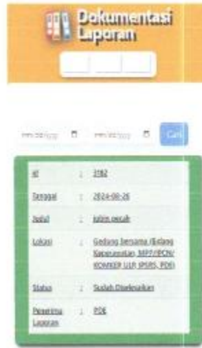
Gambar 1. 10 Dokumentasi laporan.

Apabila laporan sudah masuk, maka akan muncul menu dokumentasi laporan sebagai berikut