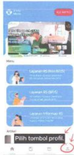
Gambar 1. 4 Halaman utama aplikasi Amino mobile

Halaman login diisikan nomor HP dan password yang sudah terdaftar di amino mobile, kemudian pilih tombol masuk