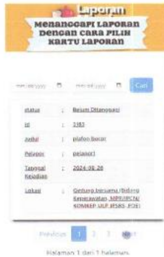
Gambar 1. 13 Kartu Laporan

Menanggapi laporan dengan cara pilih kartu laporan.