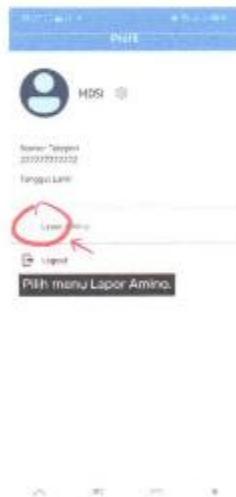
Gambar 1. 5 Tampilan Profil Amino Mobile

Setelah login berhasil, akan muncul halaman utama pilih profil.