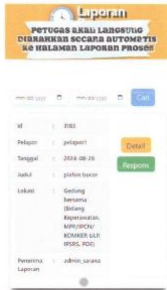
Gambar 1. 16 Halaman Laporan Proses

Setelah form tanggapan terisi semua, petugas diarahkan secara otomatis ke halaman laporan proses.